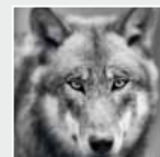
Der Leitwolf. The leader of the pack.

WOLFFKRAN GmbH Austraße 72 D-74076 Heilbronn Tel. +49 7131 9815-0 Fax +49 7131 9815-355 info@wolffkran.de www.wolffkran.de