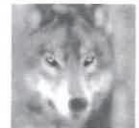
Der Leitwolf. The leader of the pack.

WOLFFKRAN GmbH Austraße 72 D-74076 Heilbronn Tel. +49 7131 9815-0 Fax +49 7131 9815-355 info@wolffkran.de www.wolffkran.de